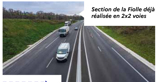
Section de la Fiolle déjà réalisée en 2x2 voies

Cette opération d'élargissement comprend notamment la déconstruction des ponts existants et la reconstruction de nouveaux ouvrages, la création du nouvel échangeur de Blanzay ouest et le réaménagement de l'échangeur existant de Blanzay centre. Un important programme de protections acoustiques, de création de cheminements modes actifs et de requalification environnementale est également mis en oeuvre.