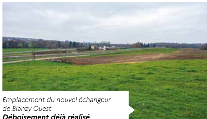
Emplacement du nouvel échangeur de Blanzly Ouest Déboisement déjà réalisé

Pour la conception du projet, les choix effectués tant sur le plan technique qu'organisationnel, ont été guidés par la volonté de mettre au point une opération dans le cadre de la démarche Eviter, Réduire, Compenser. En phase chantier, un coordinateur environnemental accompagne les entreprises pour veiller au respect des obligations réglementaires en matière d'environnement.