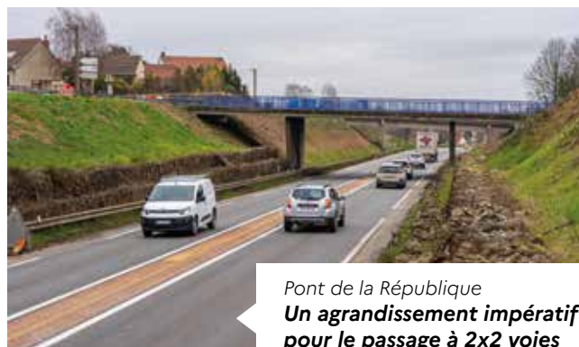
Pont de la République Un agrandissement impératif pour le passage à 2x2 voies