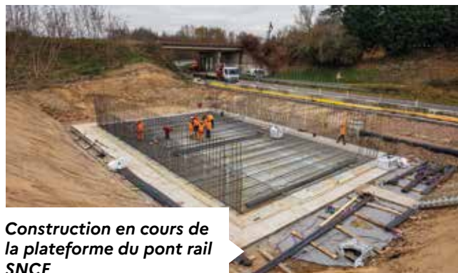
Construction en cours de la plateforme du pont rail SNCF