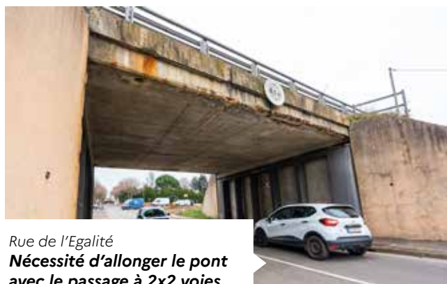
Rue de l'Égalité Nécessité d'allonger le pont avec le passage à 2x2 voies