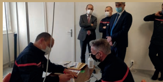
Lancement de la campagne de vaccination des sapeurs-pompiers le 13 janvier 2021

Enfin, depuis le 3 mars, la vaccination mobile est lancée en Saône-et-Loire. Une équipe de soignants se rend dans des résidences autonomes, résidences seniors, et petites unités de vie, avec un véhicule prêté par le Conseil départemental, pour vacciner les personnes de plus de 75 ans peu mobiles. Chaque semaine, c'est un nouvel arrondissement qui bénéficie de ce dispositif.