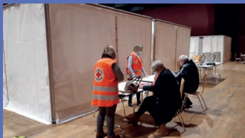
Centre de vaccination du Creusot