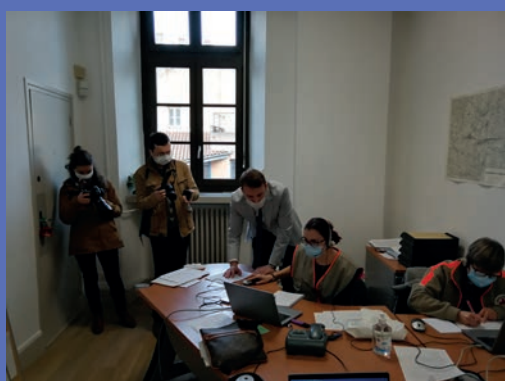
Bénévoles de la Croix-Rouge à la plateforme d'appel

Enfin, depuis le 3 mars, la vaccination mobile est lancée en Saône-et-Loire. Une équipe de soignants se rend dans des résidences autonomes, résidences seniors, et petites unités de vie, avec un véhicule prêté par le Conseil départemental, pour vacciner les personnes de plus de 75 ans peu mobiles. Chaque semaine, c'est un nouvel arrondissement qui bénéficie de ce dispositif.