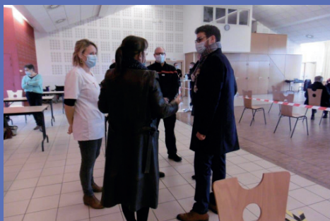
Le sous-préfet de Louhans au centre de vaccination de Branges

Les 5 et 8 janvier, les premiers centres de vaccination aux centres hospitaliers de Mâcon et de Chalon-sur-Saône ouvraient leurs portes aux professionnels de santé, ambulanciers et aides soignants de plus de 50 ans. De son côté, le Service Départemental d'Incendie et de Secours (SDIS) vaccinait également les sapeurs-pompiers de plus de 50 ans le souhaitant.