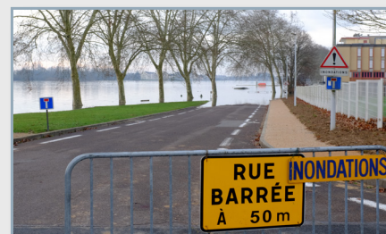
Photo : Mâcon - Janvier 2018

Vous pouvez déposer vos photos de crues sur la page d'accueil, volet "Contribuer" du site www.hydrologie-fc.fr .