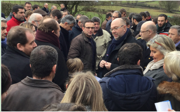
Visite du GAEC (groupement agricole d'exploitation en commun) Comeau à Saint-Eusèbe